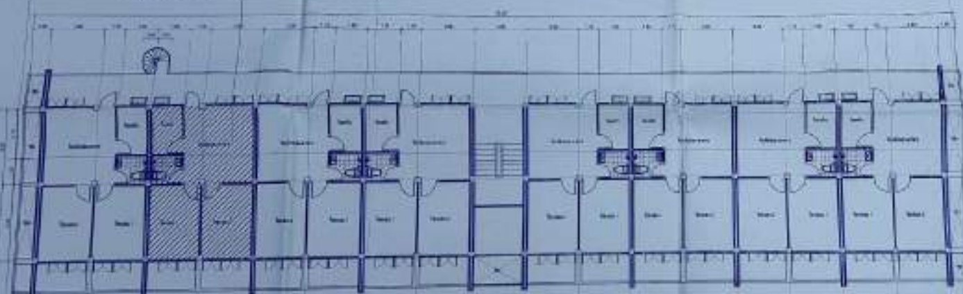
Detailing drawing 1/100