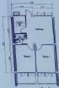
Detailing drawing 1/100