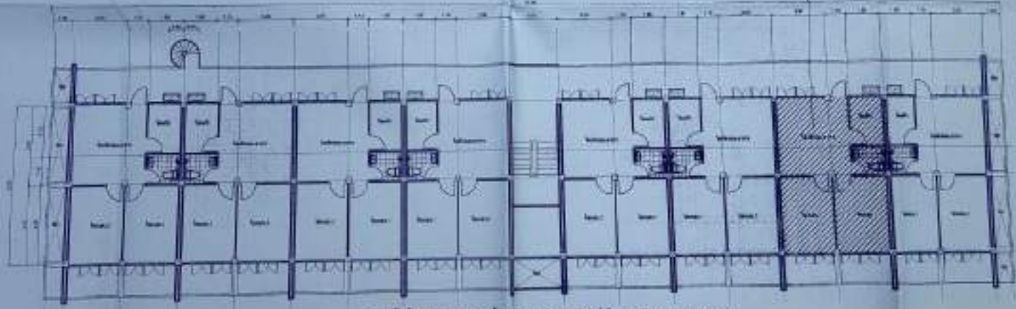
แผนผังชั้น 1 อาคารพาณิชย์ 3 ชั้น ถนนวิภาวดีรังสิต กรุงเทพมหานคร 1