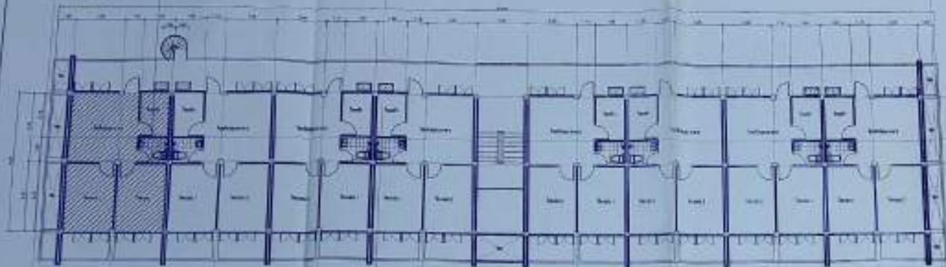
Detailing drawing 1/100