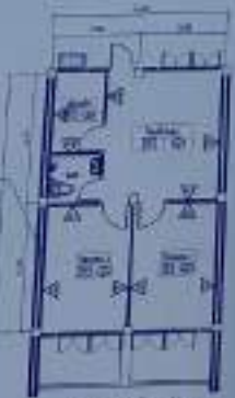
Detailing drawing 1/100

Notes: 1. All dimensions are in meters. 2. All measurements are to the center line of the wall.