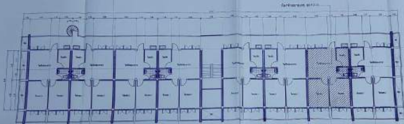
แผนผังชั้น 1 อาคารพาณิชย์ (อาคารพาณิชย์) 1:100